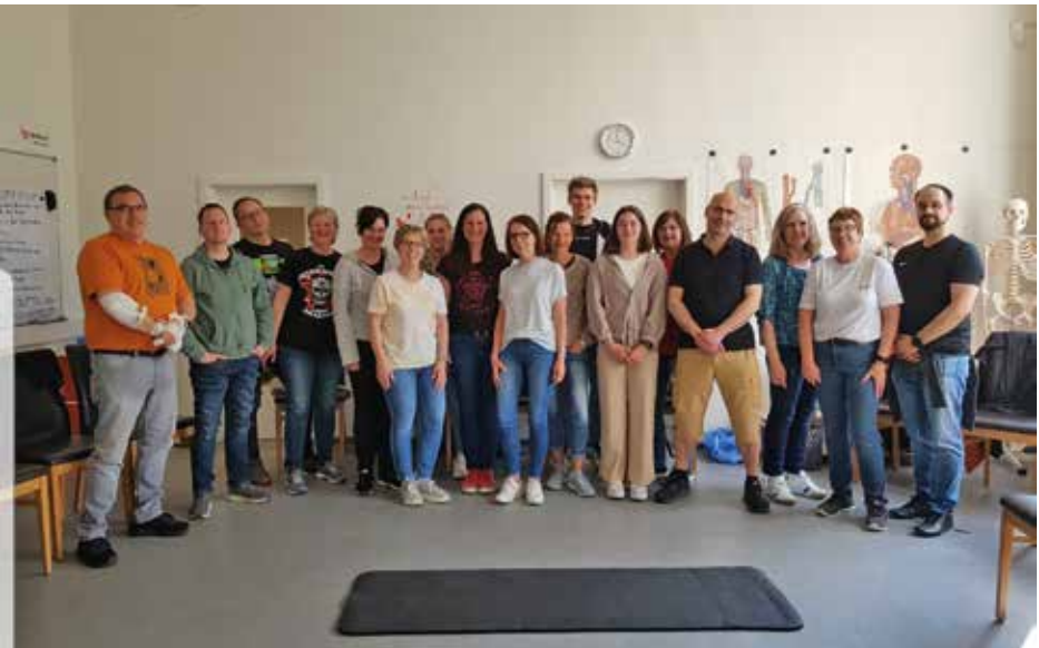
Gruppenbild der Kursteilnehmer