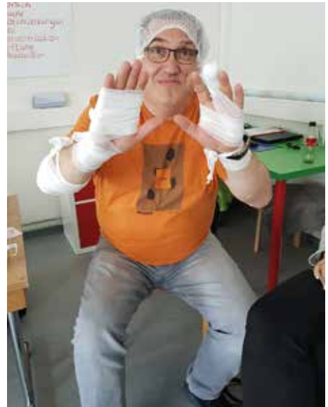
Verbände: Erste Hilfe